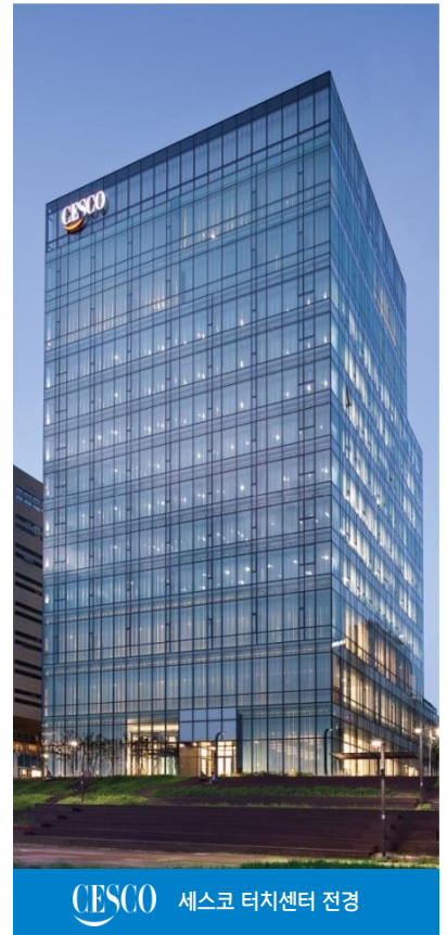
CESCO 세스코 터치센터 전경